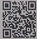
รายละเอียดกิจกรรม ใบสมัครและแบบฟอร์ม